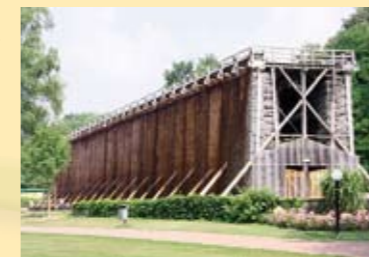
Saline im Kurpark Bad Sassendorf

Darüber hinaus besteht die Möglichkeit, in Eigenregie Bad Sassendorf (Kurpark, Saline, Thermalbad, Sauna) zu erkunden.